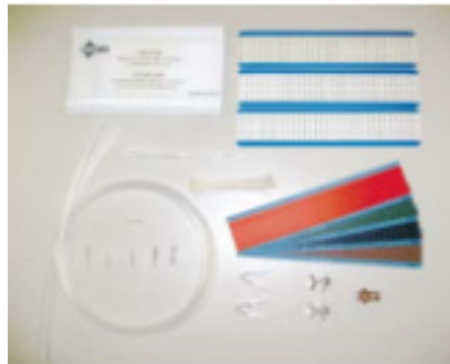
A0649869 Optická spájacia sada a bloky