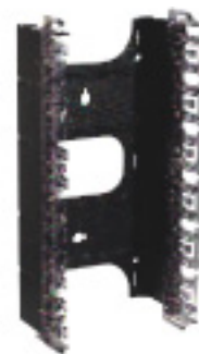
AX101472 GigaBIX držiak