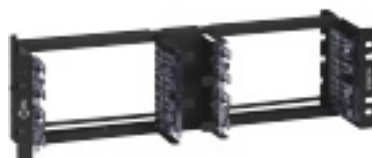
AX101986 GigaBIX panel pre stojan

GigaBIX panel na montáž do rozvádzača umožňuje adaptabilnú montáž do rozvádzačov na dátové, hlasové alebo multimediálne inštalácie. Do tohto panelu je možné umiestniť až do 8 GigaBIX konektorov na 48 ukončení 4-párových UTP káblov, alebo až 4 GigaBIX/MediaFlex adaptéry na 48 multimediálnych portov.