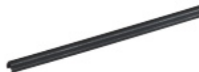
AX101486 GigaBIX chránič vodičov

GigaBIX chrániče vodičov sú pásiky z plastu, ktoré sa po pripojení káblov zacviknú a chránia stočené páry pred ťahovým namáhaním. Dodávajú sa ako súčasť GigaBIX ukončovacích sád a dajú sa objednať aj osobitne ako náhradné diely.