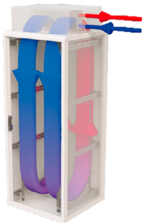
AIR FLOW THROUGH THE RACK – COOLSPOT CW TM VERSION