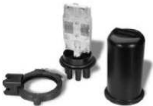
Diel číslo 140001 Použitie na 12 vlákien Ideálne v obmedzenom priestore a nízkom počte vlákien