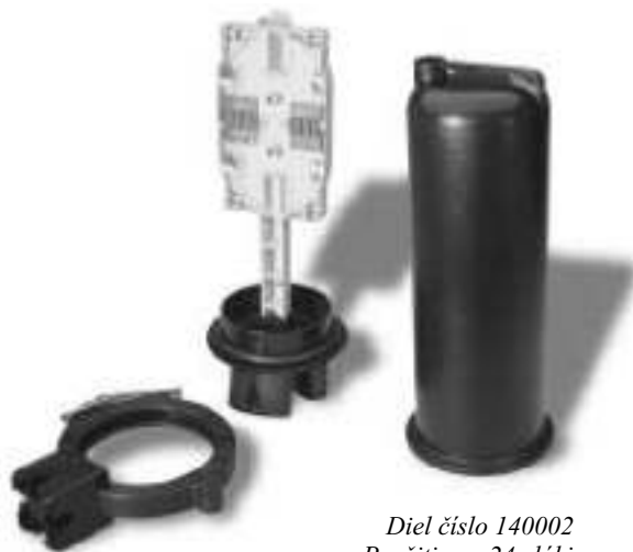
Diel číslo 140002 Použitie na 24 vlákien Prepojenie 24 vlákien

Spojky série 14000 umožňujú prepojenie do 24 vlákien pomocou jednej alebo dvoch univerzálnych 12-vláknových spojovacích kaziet. Sú ideálne na použitie s nižším počtom vlákien, ako HFC uzly, FTTC ONU, rozvody v budovách a na siete LAN. Spojky série 14000 sa jednoducho inštalujú, výborne spravujú káble a sú cenovo najvýhodnejšou voľbou na rozvody optiky s nižším počtom vlákien. Spojka 140001 má kapacitu 12 vlákien. Spojka 140002 poskytuje priestor aj na uloženie rezervnej dĺžky kábla a umožňuje prepojenie 24 vlákien.