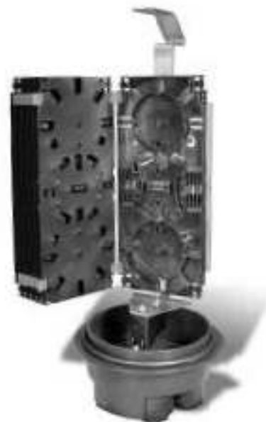
OJK-3056 Šesť spojovacích kaziet