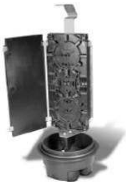
OJK-3052 Dve spojovacie kazety